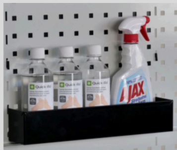
Support pour bombes aérosols (LxHxP) 380x74x70 mm noir Réf. 81.083.000