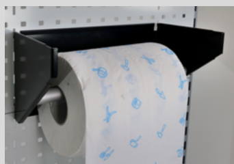
Porte-rouleau de papier (L)360 mm pour rouleau 400 mm noir Réf. 81.058.000