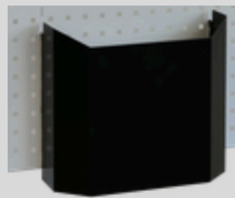
Poubelle 14 litres (LxHxP)380x300x120 mm noir Réf. 81.085.000