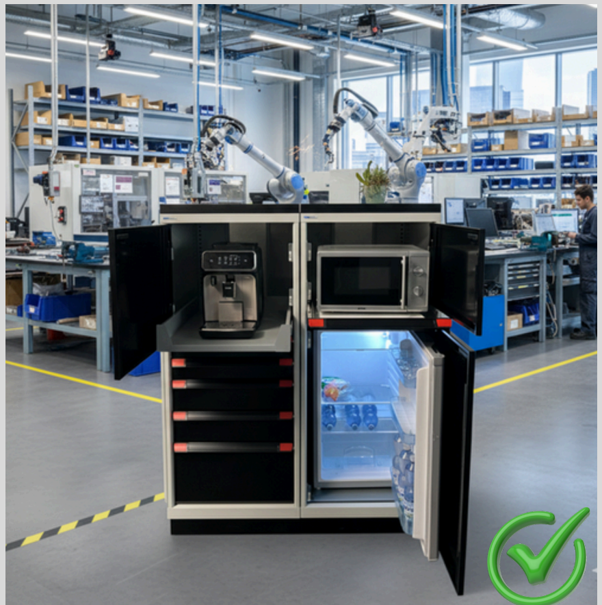
Livraison sans appareils électroménagers

Apportez dès maintenant ordre et confort dans votre entreprise. Contactez-nous pour obtenir un devis sans engagement !